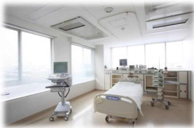
★ICU 8床 開放的