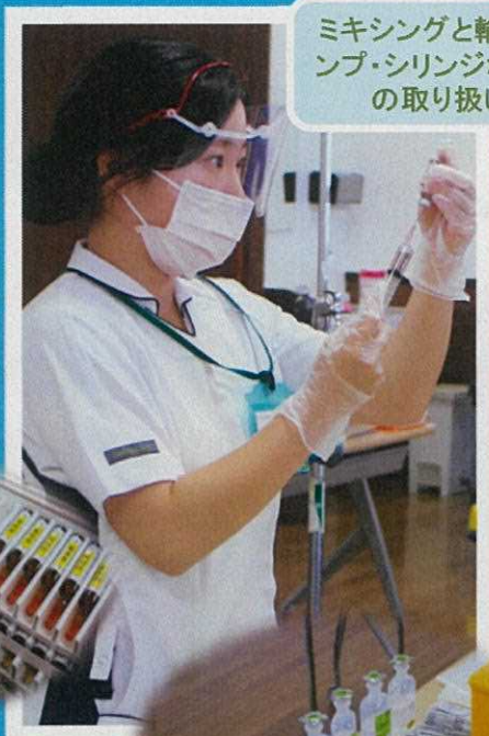
ミキシングと輸液ポンプ・シリンジポンプの取り扱い